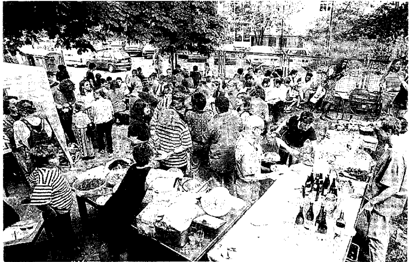
Mit vor Speis und Trank beinahe berstenden Tischen feierte das Dritte Welt Haus seinen Umzug von Rödel- nach Bockenheim. Hauptgrund zur Freude: Die bessere Lage bringt der Einrichtung mehr Besucher ein.

„Die Miete für die Räume in Rödelheim war uns auf Dauer zu teuer. Wir hatten zwar einen riesigen Veranstaltungssaal,