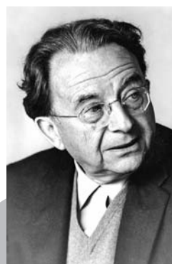
Erich Fromm, deutsch-amerikanischer Psychoanalytiker (1900—1980)

»Die eigene Liebes- fähigkeit erzeugt Liebe — so wie man auch interessant ist, indem man Interesse zeigt.«