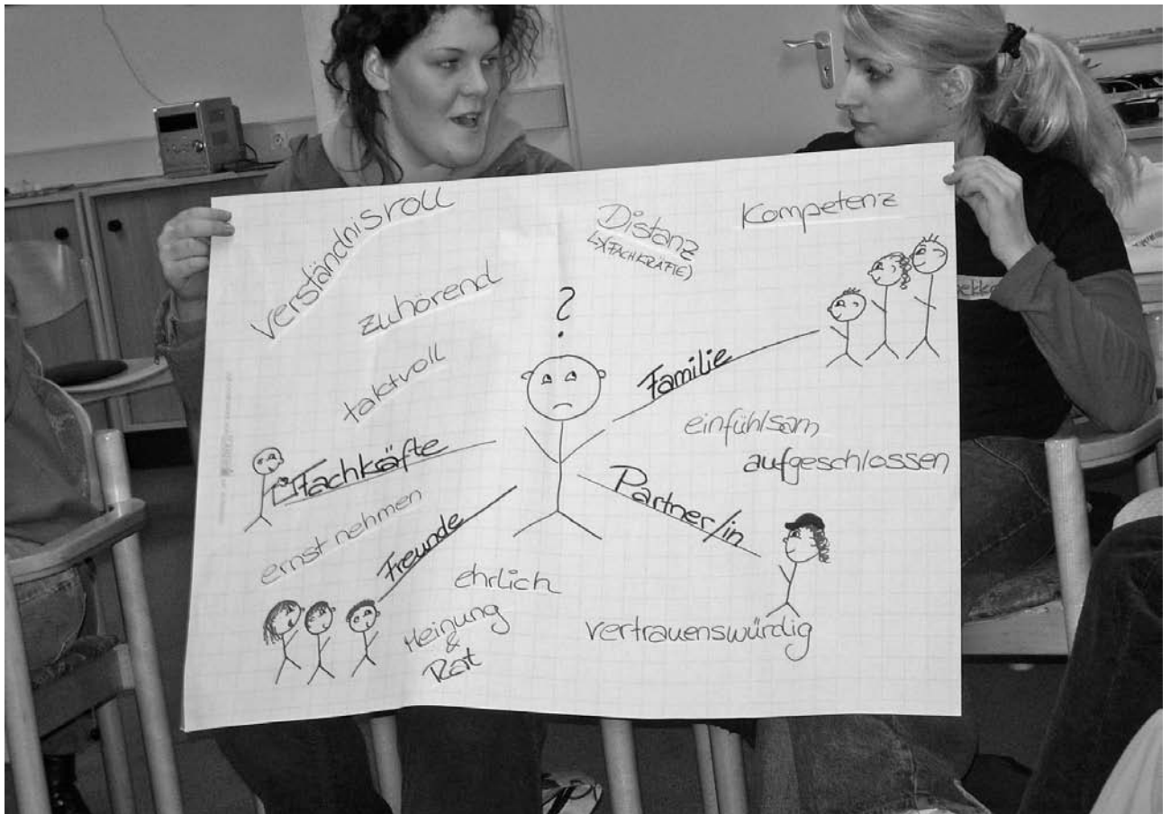
Beim Projekttag von »Verrückt? Na und!« sprechen Schülerinnen und Schüler darüber, was für sie »verrückt« bedeutet, wo man sich im Bedarfsfall Hilfe holen kann und was einen selbst stark macht.