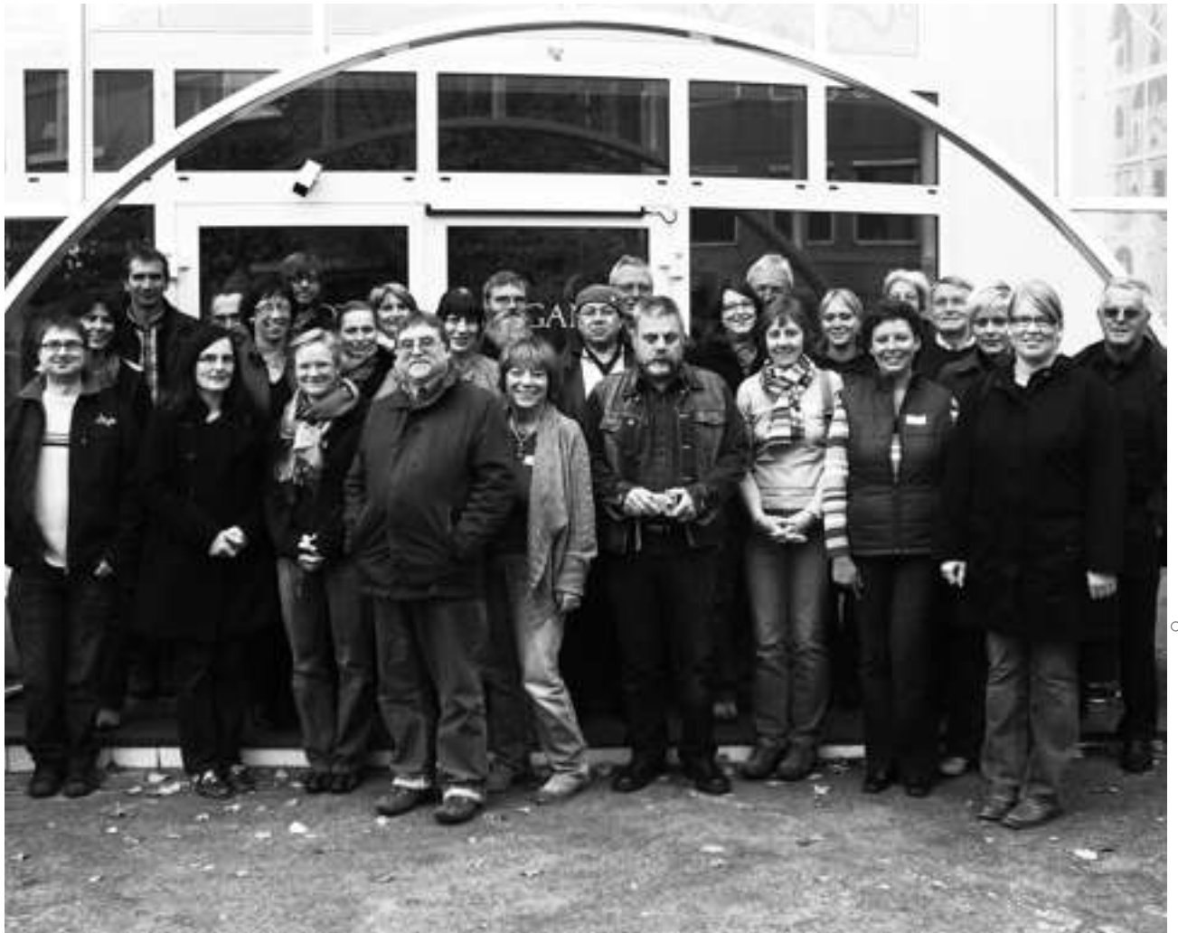
Rund einhundert Frauen und Männer haben sich in Hessen bereit erklärt, ehrenamtlich in der Bewährungshilfe aktiv zu werden. In intensiven Seminaren werden sie auf ihren anspruchsvollen Einsatz vorbereitet.

Mit einer mehrtägigen intensiven Einführungsschulung werden neue Interessenten auf den Einsatz in der Bewährungshilfe vorbereitet. Begleitend zu ihrer Tätigkeit werden für die Ehrenamtlichen regelmäßig Sitzungen zur Praxisreflexion angeboten. Ergänzend werden Fortbildungen zu unterschiedlichen Themen durchgeführt, die für die Arbeit in der Bewährungshilfe von Bedeutung sind.