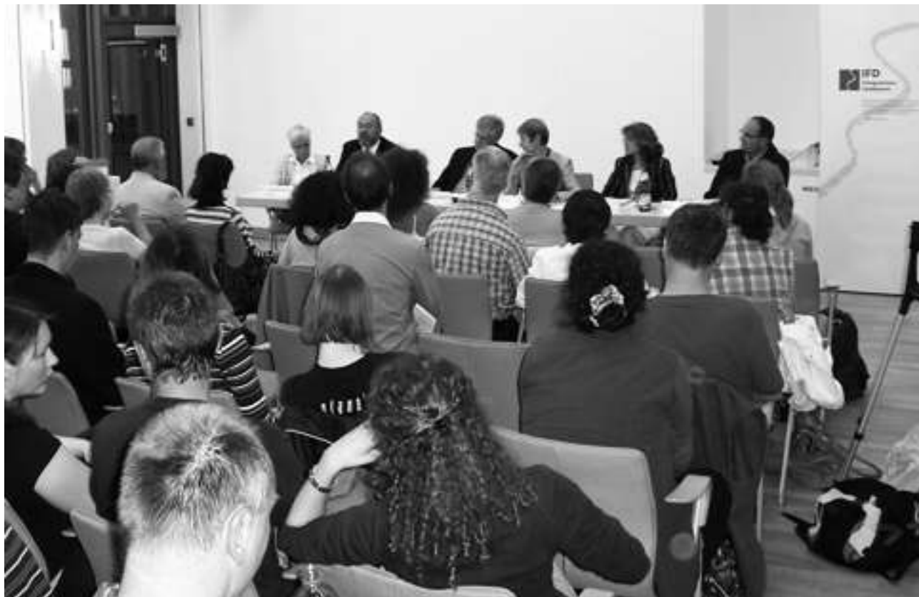
In einer Podiumsdiskussion des Integrationsfachdienstes Rhein-Main während der Frankfurter Psychiatriewoche versuchten Arbeitsmarkt-Experten darzulegen, welche Möglichkeiten es gibt, um Menschen mit einer Behinderung die gesetzlich garantierte Teilhabe am Arbeitsleben zu verschaffen.

ten, befürwortet er ausdrücklich die Einbindung des Integrationsfachdienstes sowohl in die Vermittlung als auch in die berufsbegleitende Beratung von Menschen mit Behinderung.